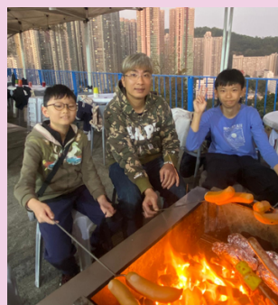
校友一家齊齊支持活動。