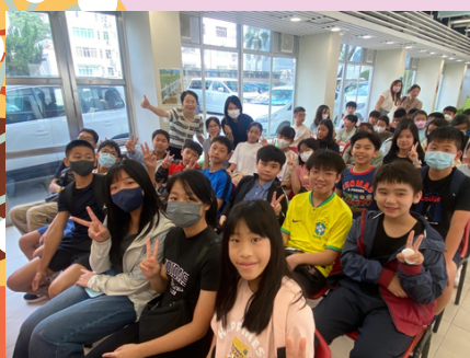
師生重聚，大家都珍惜這一刻。