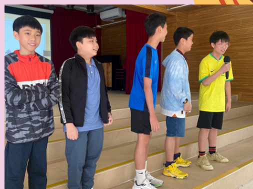
就讀不同學校的校友分享「中一生活初探」。