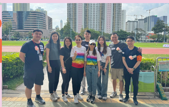
校友會委員義務出席校運會提供協助。

學校第二十三屆校運會於4月17日(星期四)在深水埗運動場舉行，當日天氣非常好，校友會主席，副主席及多位委員義務出席提供協助，本會主席更為大會提供救傷服務。運動場上，同學們傾盡全力比賽，並設有親子競技樂及師生接力賽，家長們及老師們與同學歡呼聲此起彼落，場面十分熱鬧。