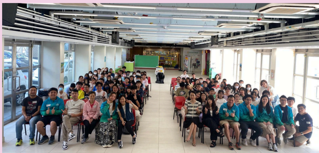
AGM圓滿結束，師生們大合照。

2024年10月5日(星期六)上午，校友會於母行禮堂舉行第十二屆校友會(2024-2025)會員大會，校長、老師和一眾校友齊齊回校支持，並趁機會暢聚一番，校友更上台分享「中一生活初探」，歡笑聲不絕於耳，場面熱鬧又溫馨。