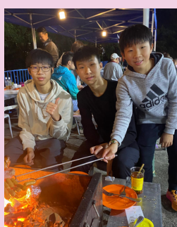
校友三兄弟到場支持。